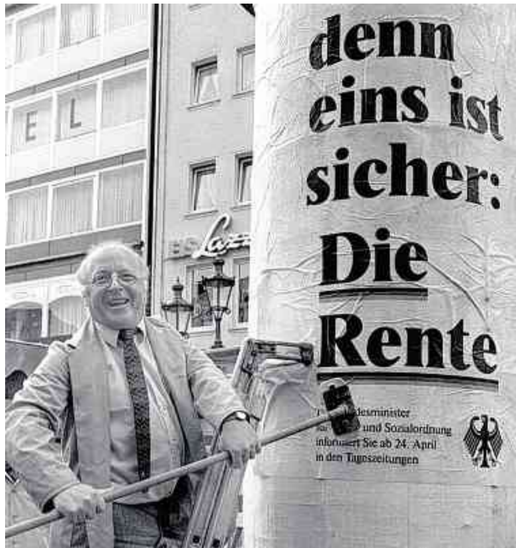
Norbert Blüm glaubte noch an die sichere Rente. Doch die Krise lässt den Slogan endgültig alt aussehen.