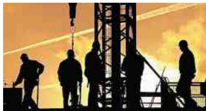
Bauarbeiter bei der Arbeit: Auch die Bundesregierung ist optimistischer als im Frühjahr. Sie will ihre Wachstumsprognose vorziehen.